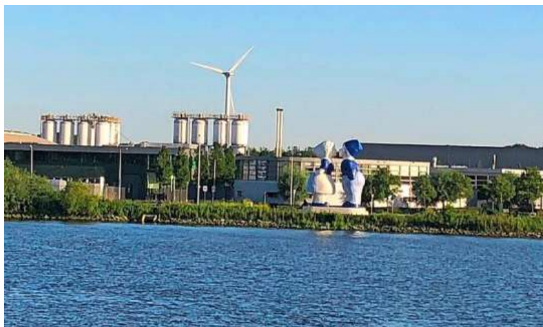
Tijdens de havensafari ontdek je de geheimen van het Amsterdamse havengebied.