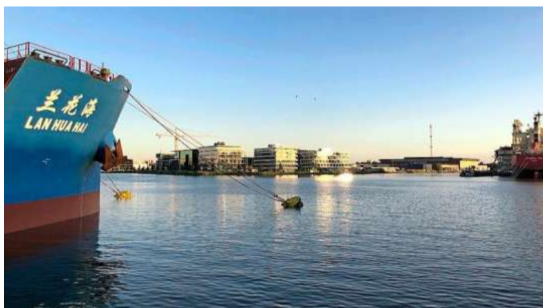
Havensafari in Amsterdam.